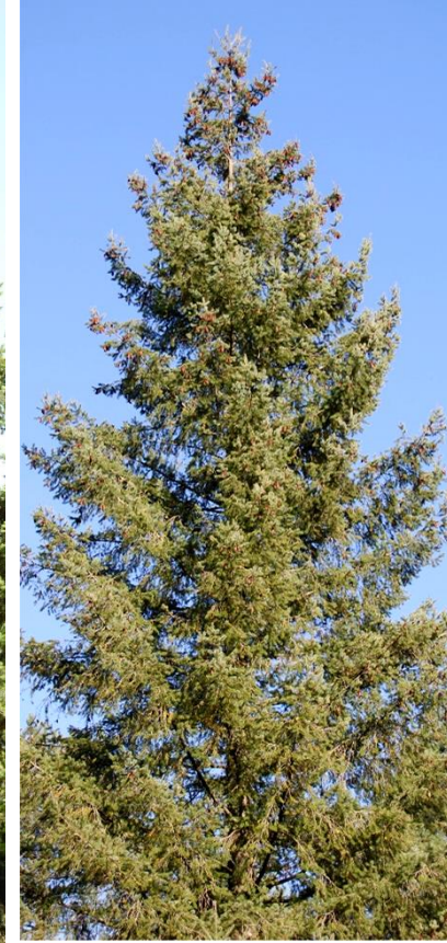
Quasi-totalité du tronc caché